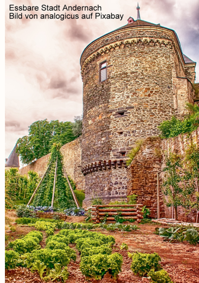
Essbare Stadt Andernach